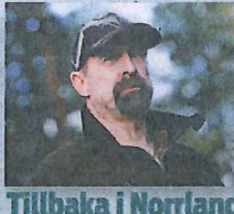
Tillbaka i Norrland