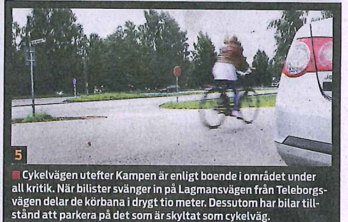
5 Cykelvägen utefter Kampen är enligt boende i området under all kritik. När bilar svänger in på Lagmansvägen från Teleborgsvägen delar de körbana i drygt tio meter. Dessutom har bilar tillstånd att parkera på det som är skyltat som cykelväg.

GRAFIK: KENNETH GERHMAN, FOTO: LENA GUNNARSSON