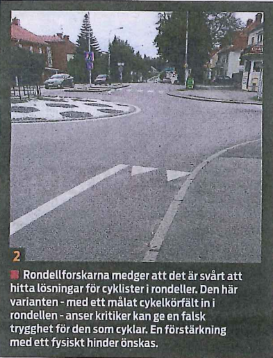
2 Rondellforskarna medger att det är svårt att hitta lösningar för cyklister i rondeller. Den här varianten - med ett målat cykelkörfält i rondellen - anser kritiker kan ge en falsk trygghet för den som cyklar. En förstärkning med ett fysiskt hinder önskas.