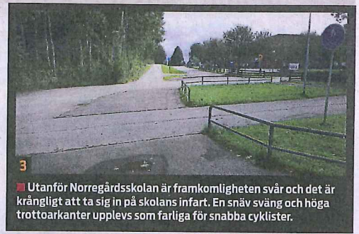
3 Utanför Norregårdsskolan är framkomligheten svår och det är krångligt att ta sig in på skolans infart. En snäv sväng och höga trottoarkanter upplevs som farliga för snabba cyklister.