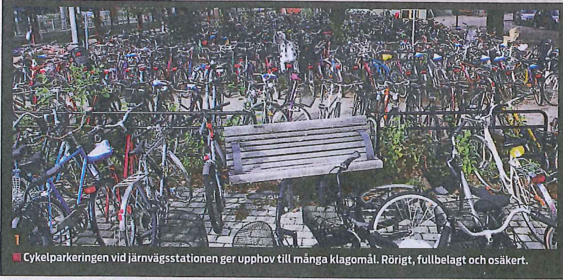
1 Cykelparkeringen vid järnvägsstationen ger upphov till många klagomål. Rörigt, fullbelagt och osäkert.