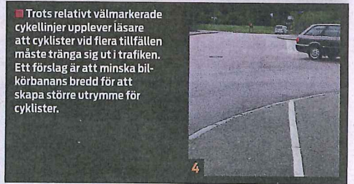
4 Trots relativt välmarkerade cykellinjer upplever läsare att cyklister vid flera tillfällen måste tränga sig ut i trafiken. Ett förslag är att minska bilkörbanans bredd för att skapa större utrymme för cyklister.