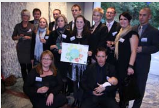
Team Ahlgren

BRYSSEL Första priset i den europeiska tävlingen Energismarta grannar (Energy Neighbourhoods) gick till Team Ahlgren från Karlskrona. Team Ahlgren, som bestod av sex hushåll, lyckades med den imponerande bedriften att kollektivt sänka sin energiförbrukning med 37,63 procent. I tävlingen som pågick från november förra året fram till den sista april i år deltog över 500 lag från nio länder i Europa.