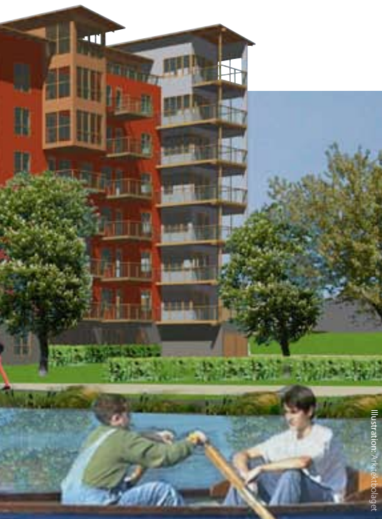
Illustration: Mikael Ödgers