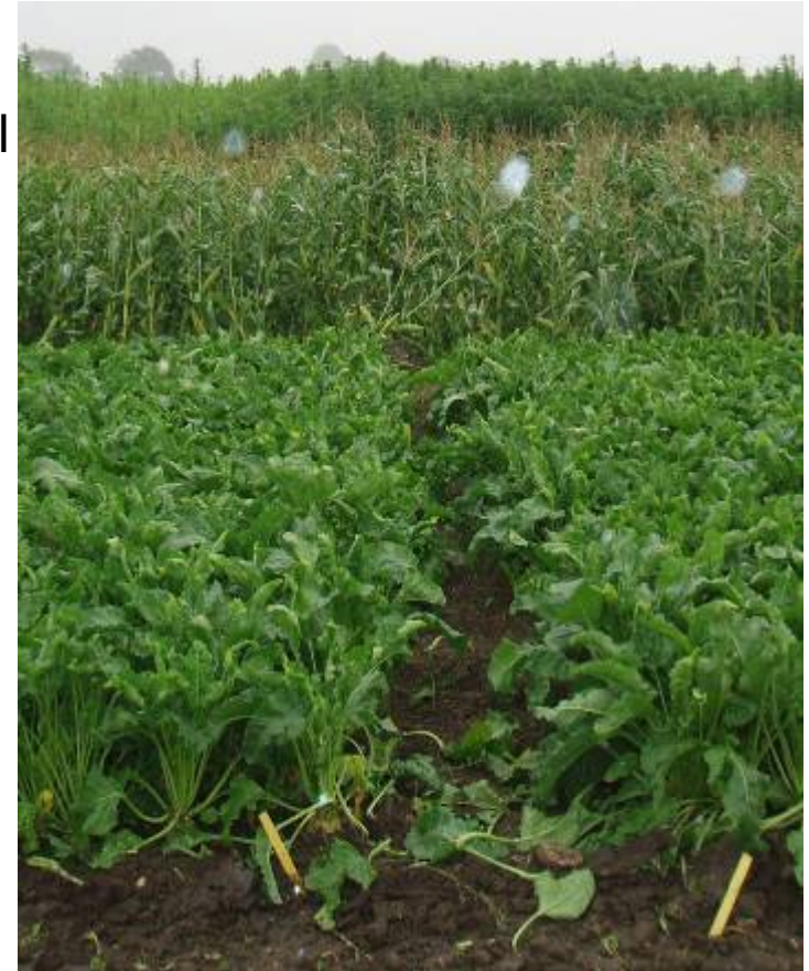
Trial cultivation, energy crops, SLU-Alnarp